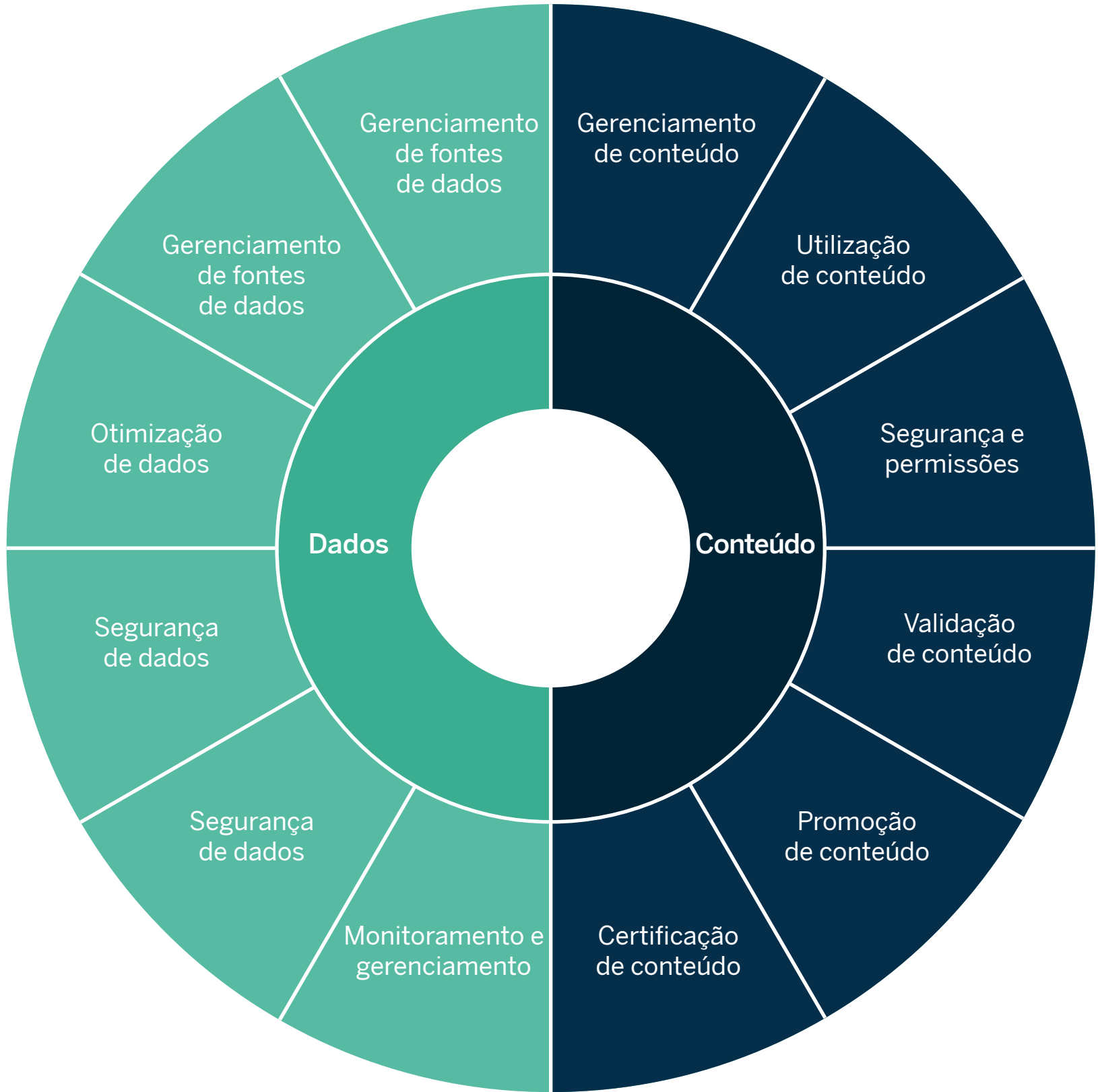
O Tableau oferece uma estrutura de governança que inclui a governança de dados e a governança de conteúdo.

É fundamental atentar ao fato de que cada tipo de dados exige um nível diferente de governança. Ainda mais importante é saber que a análise de autoatendimento governada e escalonável deve ser considerada uma jornada contínua e em constante adaptação, e não um destino em si. Seu modelo de governança será um sucesso se você puder se adaptar a necessidades em constante evolução e manter os usuários informados, capacitados e comprometidos a seguir as políticas da empresa à medida que a participação aumentar.